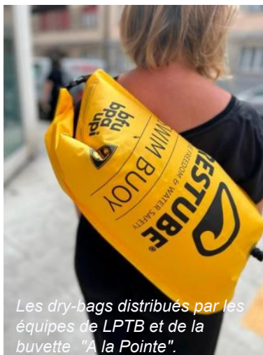
Les dry-bags distribués par les équipes de LPTB et de la buvette "A la Pointe".

Cette année, plus de 9000 interventions et échanges ont été effectués avec les usager.x.ère.s du sentier des Saules. De plus, le bureau de prévention des accidents a mis à disposition des sacs de baignade et de sécurité, appelés dry-bags, munis de sangles de sécurité.